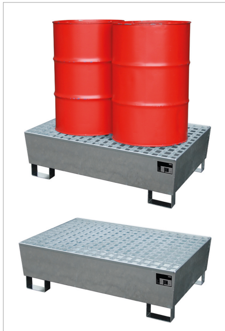
Typ AW-S 2/200