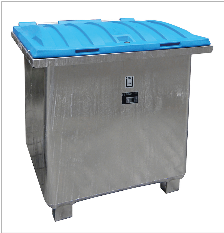
Typ ASO-D 800