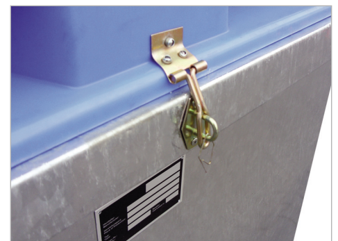
Kunststoffdeckel arretier- und abschließbar