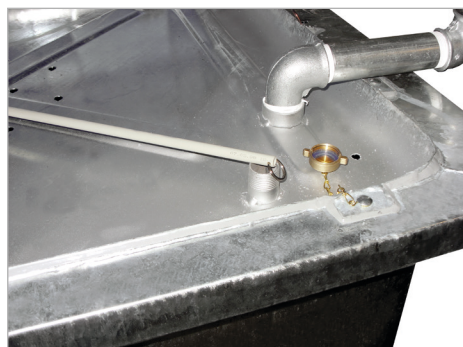
Peilstab zur Füllstandskontrolle