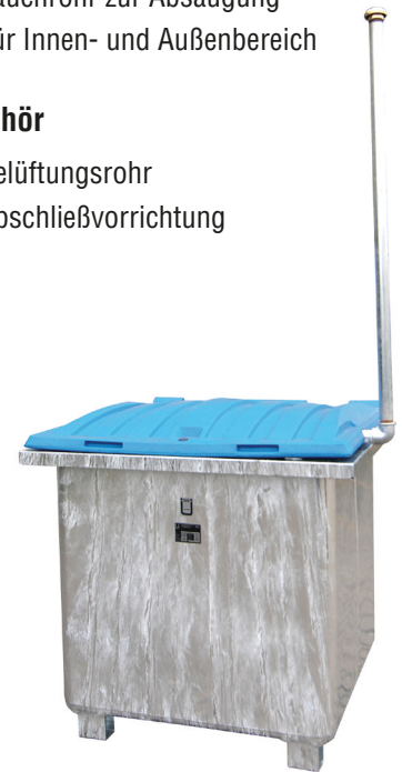
Typ ASO-D 800 mit Belüftungsrohr