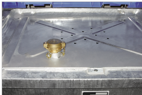
Einlaufwanne und 2" Tankwagenkupplung