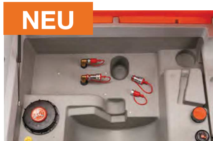
CUBE Mobil 980 Generatortank mit 2 Anschlüssen

Schnellkupplungsset jeweils mit Gegenstück und Anschluss 1/2" IG für Vor- und Rücklauf passend zu mobilen Ölheizern und Generatoren