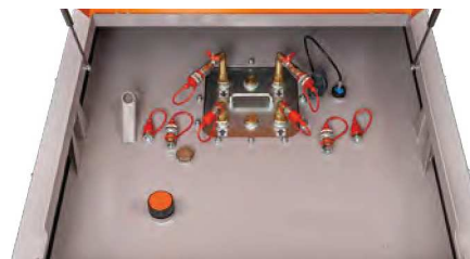
DT-Mobil PRO ST 980 Basic Generatortank mit vier Anschlüssen