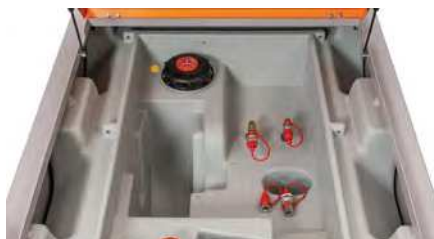
DT-Mobil PRO PE 980 Generatortank mit zwei Anschlüssen