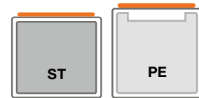
DT-Mobil PRO Außenbehälter aus Stahl, Innenbehälter aus Stahl oder PE