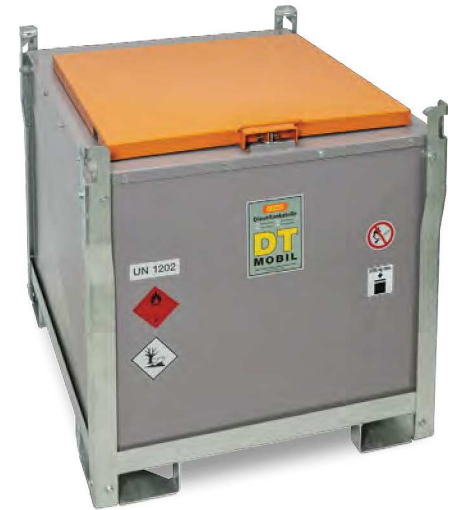
DT-Mobil PRO ST 980 Generatortank

Wiederkehrende Prüfungen alle 2 1/2 Jahre (siehe ADR 6.5.4.4.1 b und ADR 6.5.4.4.2 b).