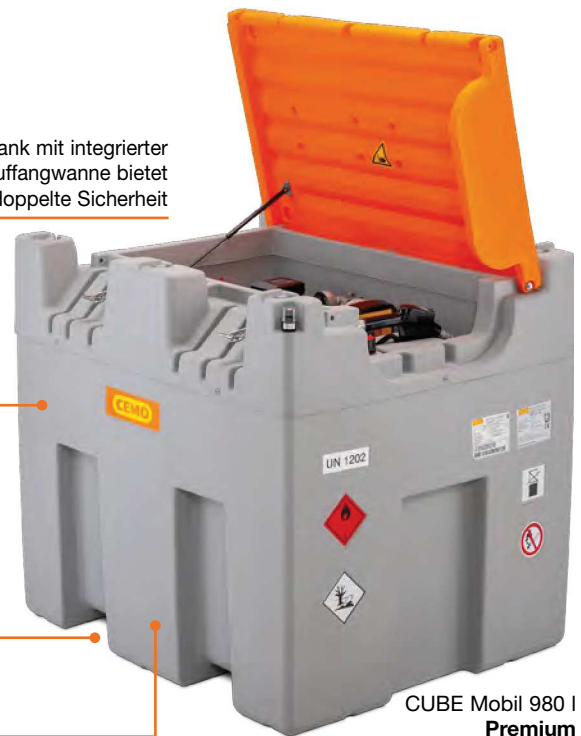
CUBE Mobil 980 I Premium

Zugelassen zur Lagerung und zum Transport