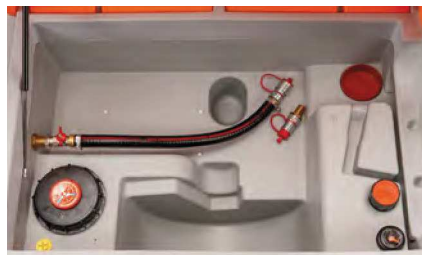
Ausführung ohne Pumpe mit Schnellkupplung

mit leistungsfähiger Elektropumpe, Schlauchaufroller mit 8 m Schlauch DN 25, Zähler, Filter mit Wasserabscheider und Automatik-Zapfpistole