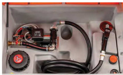
Ausführung Basic mit Cematic Duo 24/12 V

Elektropumpe Cematic 72, 230 V, 500 W, ca. 72 l/min*