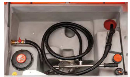
Ausführung mit Handpumpe 60 l/min