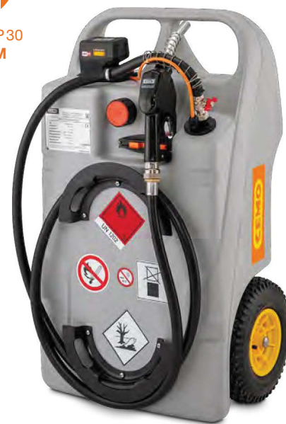
Dieselrolley 100l mit Elektropumpe CENTRI SP30 18 V und CAS-Akku

Zubehör digitaler Durchflusszähler K 24 zur Montage zwischen Befüllschlauch und Zapfpistole siehe Seite 123.