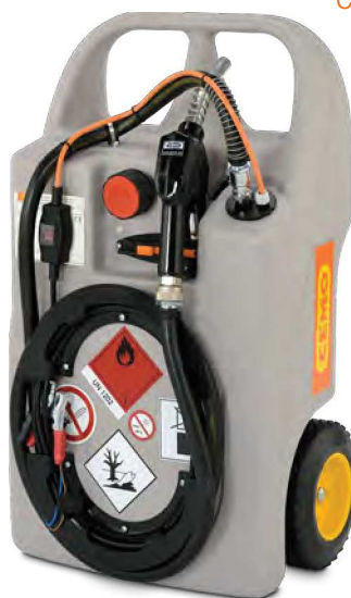
Dieselrolley 60l mit Elektropumpe CENTRI SP30 12 V