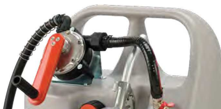
Dieselrolley 60l mit Kurbelpumpe

Zubehör digitaler Durchflusszähler K 24 zur Montage zwischen Befüllschlauch und Zapfpistole siehe Seite 123.