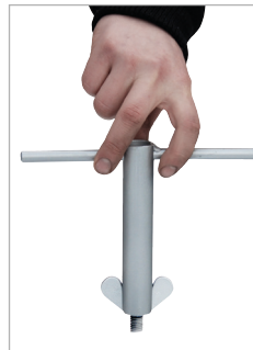
Schlüssel für Flügelmutter

Betanken von Bau- und Arbeitsmaschinen, Geräten, Aggregaten etc. Internationale Beförderung gefährlicher flüssiger Güter nach ADR/RID/IMDG-Code, Verpackungsgruppen II und III