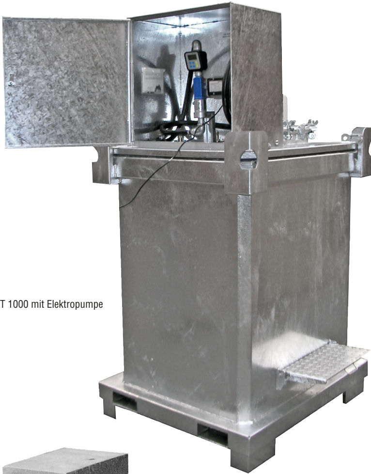
Typ DT 1000 mit Elektropumpe