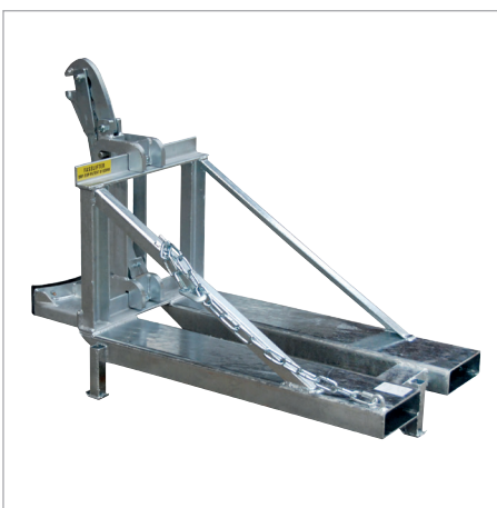
RS-I/M mit Stützfüßen für Pratzstapler