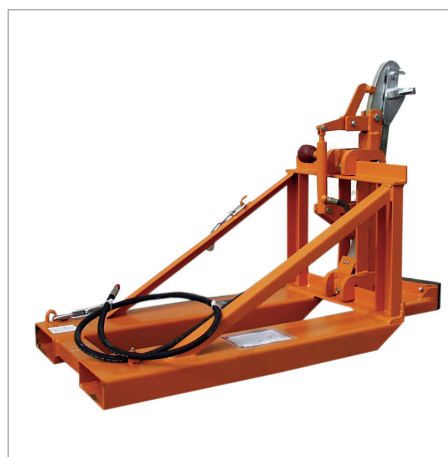
RS-I/91 mit hydraulischer Klemmsicherung